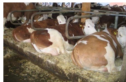
Добро състояние на