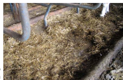
Лошо състояние на