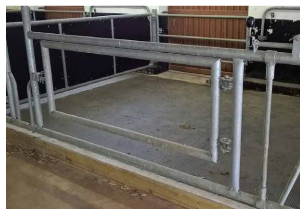
Монтираната VITA с подвижна фиксираща врата в учебно- експерименталния център Köllitsch