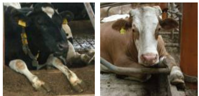
tabla de pecho inconveniente: la vaca tiene áreas depiladas en sus articulaciones delanteras